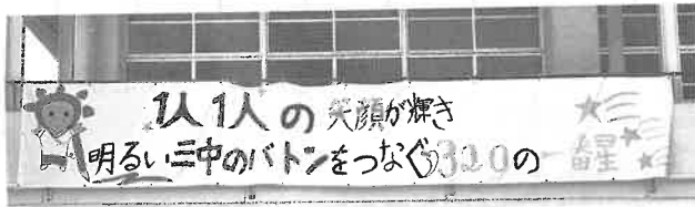
第三中学校のスローガンが書かれた横断幕

その全員が自分の輝けた瞬間を見つけ、星形の紙に書き込み、掲示を行いました。今後もいいところ探しを継続して行っていく予定です。